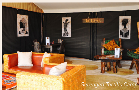
Serengeti Tortilis Camp