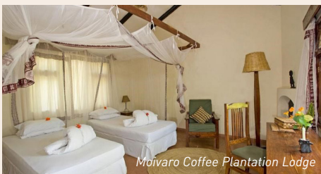
Moivaro Coffee Plantation Lodge