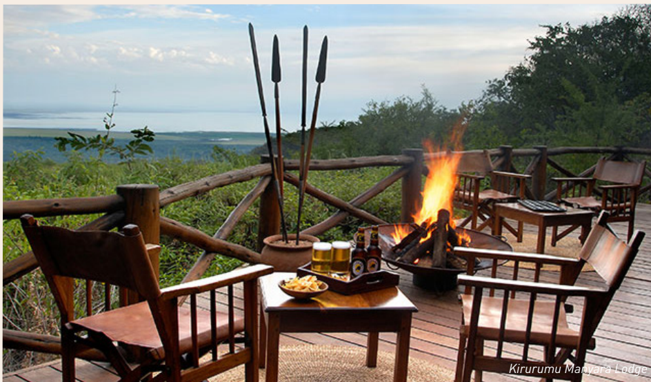
Kirurumu Manyara Lodge