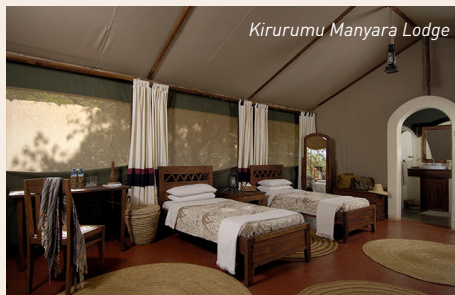
Kirurumu Manyara Lodge