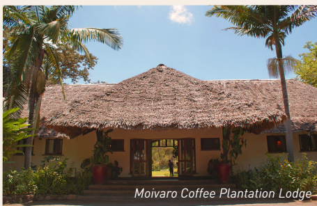
Moivaro Coffee Plantation Lodge