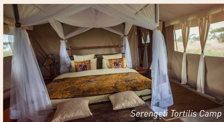
Serengeti Tortilis Camp