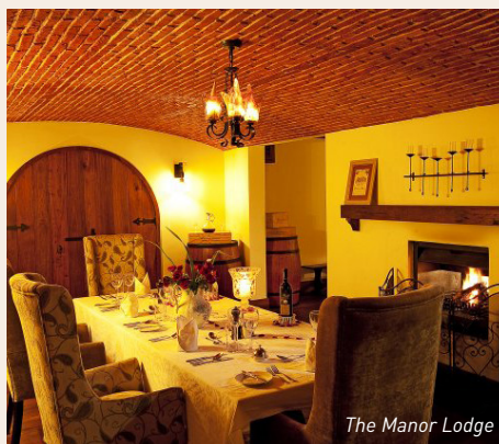
The Manor Lodge