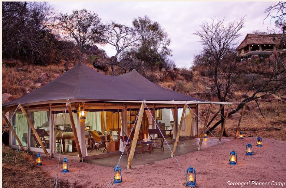
Serengeti Pioneer Camp