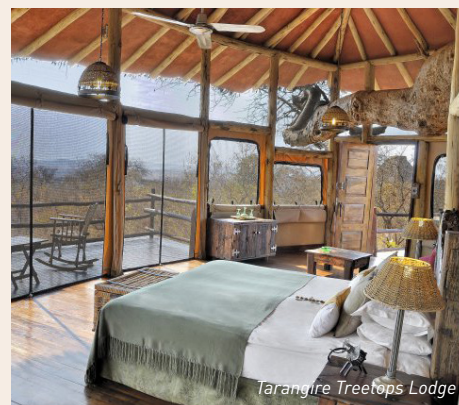
Tarangire Treetops Lodge