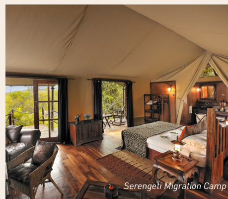
Serengeti Migration Camp