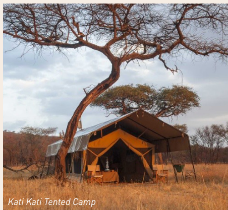
Kati Kati Tented Camp