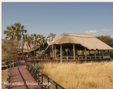
Maramboi Tented Camp