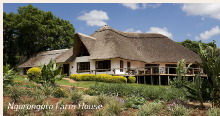
Ngorongoro Farm House