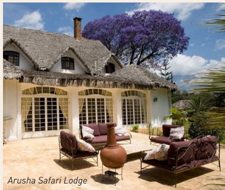
Arusha Safari Lodge