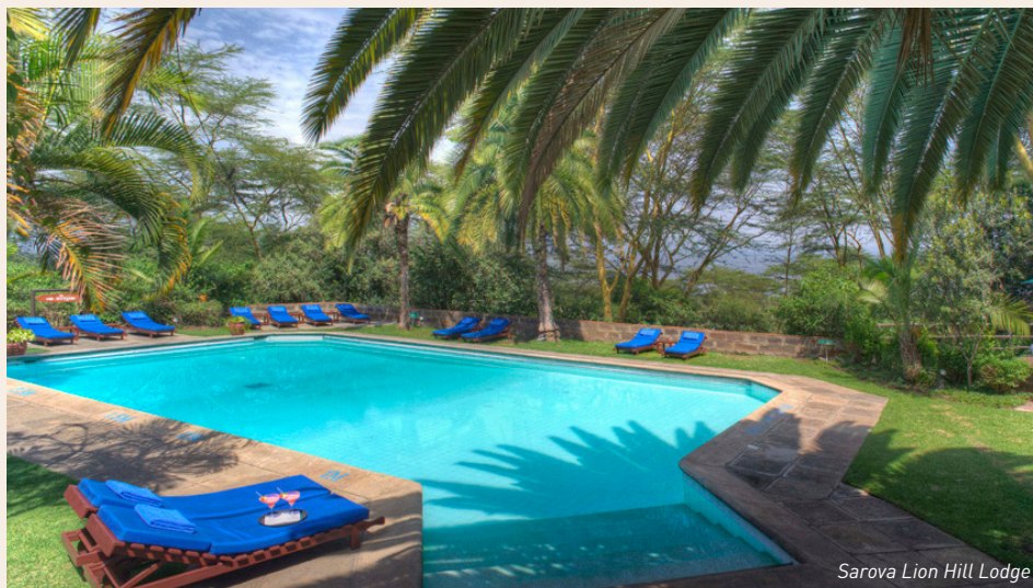
Sarova Lion Hill Lodge