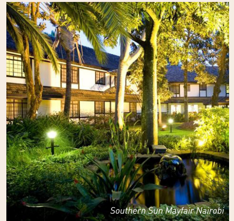
Southern Sun Mayfair Nairobi