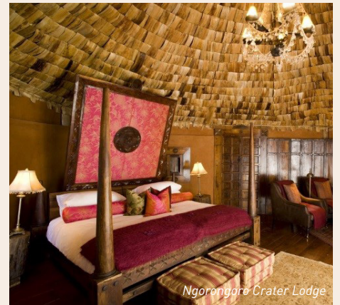
Ngorongoro Crater Lodge