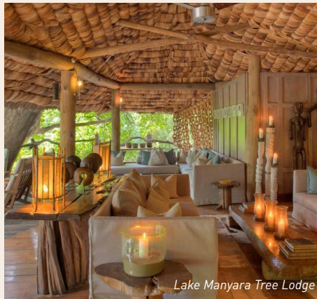
Lake Manyara Tree Lodge